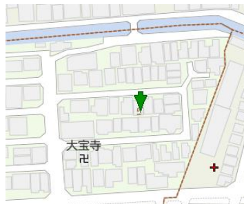
地図上：プレアール鴻池